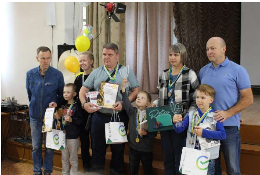
Городской шахматный турнир «Шахматная Семья»